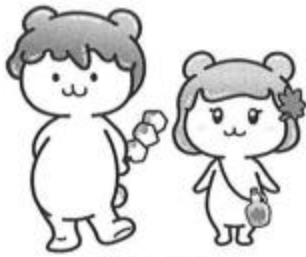
秩父市イメージキャラクター ポトクんとふめるちゃん