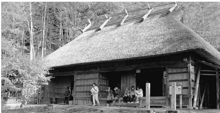
旧大滝村の神領民家

充実、維持管理費への支援なども国へ要望していく。ご指摘いただいたバイオマスエネルギーの委員会の活用は、今後バイオマスタウン構想の専門委員会として協力依頼していきたい。