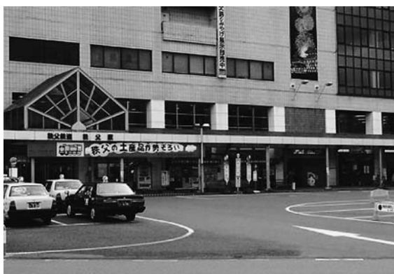
日曜日でも閑散とする秩父駅前

答 業者側の事情で切替えることになった。来年9月より新業者に切替わる。浦添市の話しは承知している。今後の参考としたい。