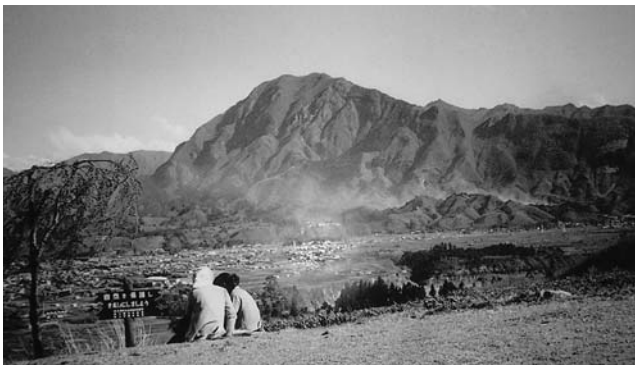
県北美術展「五十年の変遷」より武甲山全景(昭和34年)

答 各項取り組み、市民会議設置は秩父環境連絡協議会に、市も構成員加盟し促進する。