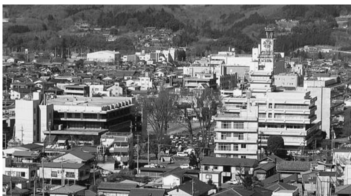
耐震構造の問題を抱える市民会館と市役所庁舎