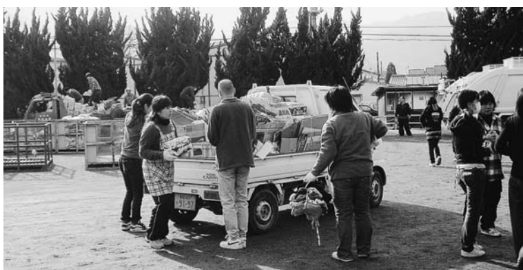
12月13日の中村町育成会廃品回収

答 確かに事故があつた場合は大変なことである。その保障に関しては、今後、十分検討していきたい。良い提案をもらったと思う。