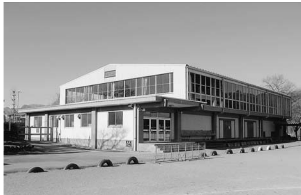
吉田小学校体育館

答 良質な飲料水を提供することは、「市の責務」ともいえるべき事柄であるので、水道部と吉田総合支所の連携の下に実施し、公営水道が整備されている地域と同様の状態の実現を担保していきたい。 問 吉田小学校体育館及びプールの改修について。