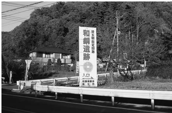
国道140号線黒谷遺跡入り口に立つ看板

答 職員の意識を高め、企業感覚で任務に当たる点で大変参考になる。今後、研究したい。