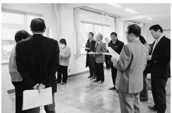
秩父第二中学校校舎改造工事の現地調査の様子