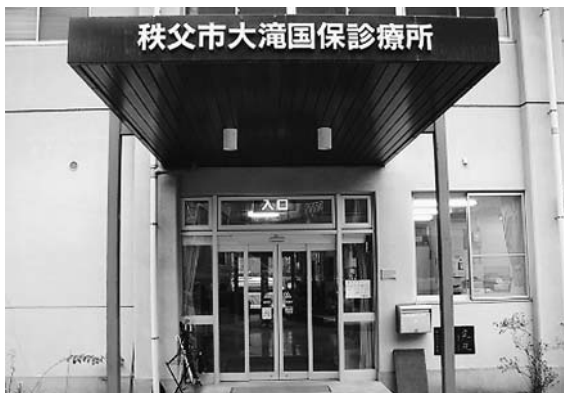
地域医療拠点の大滝国保診療所

問 合併効果があるというが大滝地域では幼稚園の廃止、高校寮の跡地売り払いなど、地域に配慮