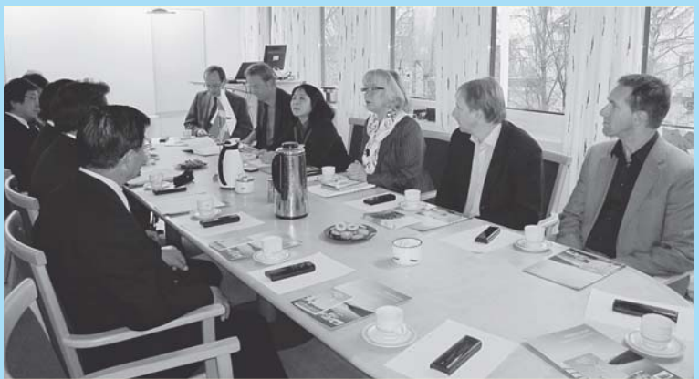
ヴェステルボッテン県庁にて 県知事らと意見交換

視察内容のすべてを紹介することはできないが、今回の視察は、大変実り多い、有意義なものであった。特に林業振興、福祉、環境の各対策は、自治体主導により取り組むことが必要と考えるが、とりわけ産業の発展については、産業界と行政が強い協力関係を持ちながら、地域経済の活性化に取り組むことが市の財政基盤の強化につながり、住民福祉の向上の原動力となることを再確認した。そういった意味からも、今回の公式訪問は、官民双方にとって、大変意義あるものとなった。