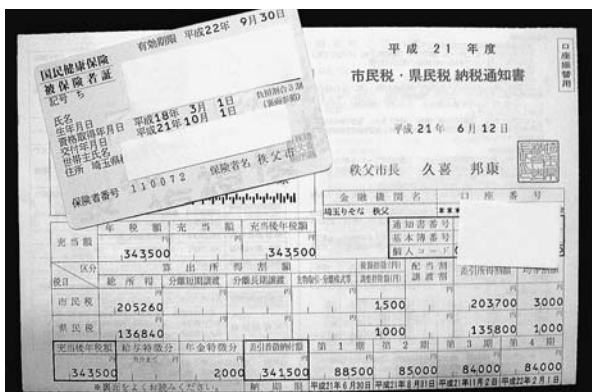
国民健康保険証と市税等納税通知書

答 納期は、地方税法に基づいて決められており、現状では画一的に納期の平準化を計ることは困難であると考えているが、なお今後研究していきたい。納付が困難な方等については、納税猶予や分割納付について、個々に対応しているので相談して欲しい。