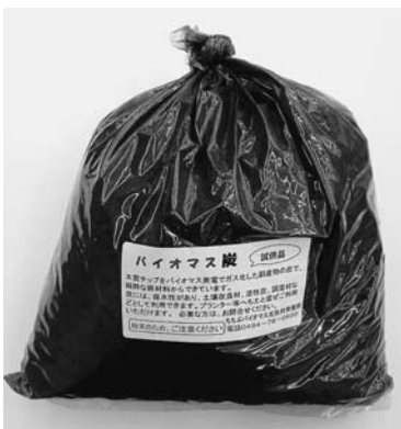
バイオマス副産物の炭

することにした。 ※今回の補正は、職員の人件費の削減が中心になっており、議案第105号に反対した経緯から本来なら好ましくない補正予算だが、緊急を要するものも含まれているので、あえて反対はしない、との意見が出された。 ○原案のとおり可決 ◆平成21年度秩父市農業集落排水事業特別会計補正予算(第2回) ※この補正予算は職員の人件費が削減されている補正であるので、議案第105号に反対した経緯から反対する、との意見が出された。 ○挙手多数により可決 ◆平成21年度秩父市戸別合併処理浄化槽事業特別会計補正予算(第2回) ※この補正予算についても職員の人件費が削減されている補正であるので、議案第105号に反対した経緯から反対する、との意見が出された。 ○挙手多数により可決