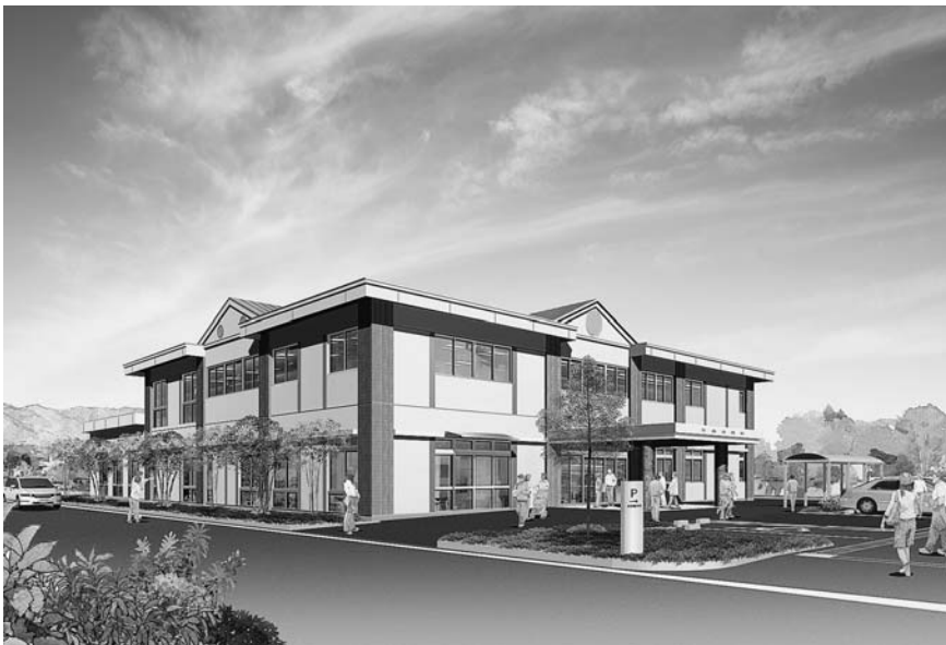
(仮称) 影森公民館・学童保育室完成予想図

秩父市議会12月定例会は、11月27日から12月16日までの20日間を会期として開かれました。この12月議会では、市政全般に対する一般質問に20名の議員が登壇し、市政発展のための活発な論議が展開されました。審議した議案は、初日(27日)に市長から提出された25件、最終日(16日)に追加議案として3件、議員から提出された3件の議案、合計31件の議案です。上程された議案は、原案可決及び同意されました。他に請願3件が審議され、採択されました。