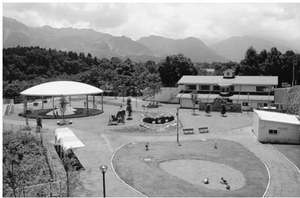
ちちぶキッズパーク

問 吉田中学校の敷地内に予定されている(仮称)北部共同調理場は、給食の配送に最長20分もかかり(現在市全体の平均配送時間は11分)、子どもたちに新鮮で安全な給食を提供できるか不安。万難を排してでも、当初計画した通り吉田・太田・尾田藪の中心地であ