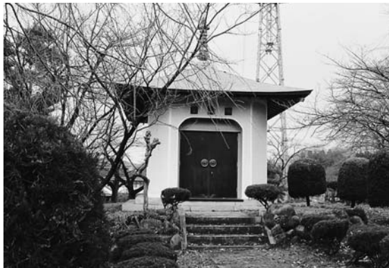
聖地公園内にある「聖霊殿」

答 聖地公園には類似の施設「聖霊殿」があり、現在の規定ではすぐに利用はできないが、利用者等の意向も聞きながら、有効に利用していきたいと考える。