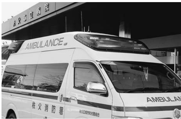
体制強化の求められる救急医療