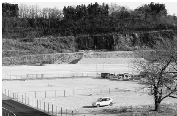
太平洋セメントプラント跡地

問 森林環境税の取組みについて。 答 「全国森林環境税創設促進議員連盟」に加入し、森林環境税の