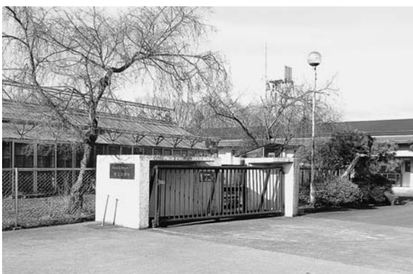
埼玉県農林総合研究センター秩父試験地

問 秩父市は秩父市名産品の発売に努力しているが、農産物の試験機関である埼玉農林総合センター1秩父試験地が来年廃止となる。