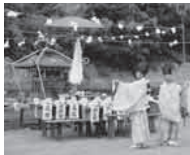
神輿洗いの後、河原に設けられた齋場では祭典が行われ、代参宮神樂が奉納されます。

なお、お水取り行事など一連の行事が、昭和57年9月10日に「川瀬祭の民俗行事」として、市の無形民俗文化財に指定されています。