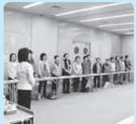
参加者全員で発声練習!

私たちは、自分が本当に相手に伝えたいことをどれだけ正しく伝えられているでしょうか? 佳山さんによる講義のなかで、