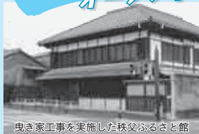
曳き家工事を実施した秩父ふるさと館

秩父ふるさと館が中町・本町の中央通線拡幅工事にともなう曳き家工事および改修工事を終えて、リニューアルオープンしました。