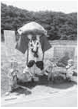
昨年度一般の部 埼玉県知事賞の作品

展示期間 8月1日(土)～9月27日(日) 展示場所 吉田フルーツ街道沿線 対象 秩父郡市内の個人・団体 作品規定 高さ1mの杭に固定し、自力で立つこと(作成費は自己負担) ※優秀作品を表彰します。 申 7月28日(火)までに吉田総合支所 地域振興課(☎72-6083)へ HP 「秩父フルーツ街道」で検索!