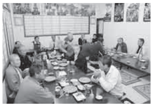
本格そばを味わいながら交流を深める皆さん

この街には、地域の皆さんとの絆(きずな)を深めたり、生活を支援するために活動している方がたくさんいます。地域に根差し、楽しみながら秩父を元気にしてくれている皆さんに注目し、折に触れて紹介していきます。