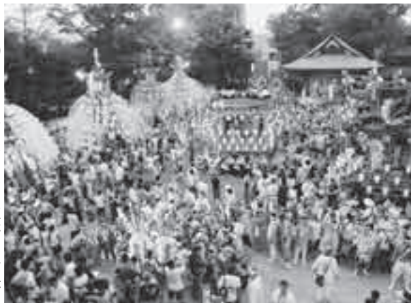
7月19日の宵宮では、8台の笠鉾・屋台が秩父神社境内に集まり、「天王柱立て神事」が厳かに行われます。

秩父神社境内にある日御碕宮の祭りである川瀬祭の始まりは不明ですが、『井上家文書』（秩父図書館蔵）には、万治二年（1659）に「六月一五日の川瀬の祓」を行っていた記録が残っています。当初、市内荒川の武之鼻河原における祓の神事が中心であったものが、文化年間（1804～1818）のころに神輿洗いが行われる祭りとなりました。明治17年以降、笠鉾・屋台が建造され、付祭りとして奉曳するようになり、現在8台の笠鉾・屋台が曳き廻されています。