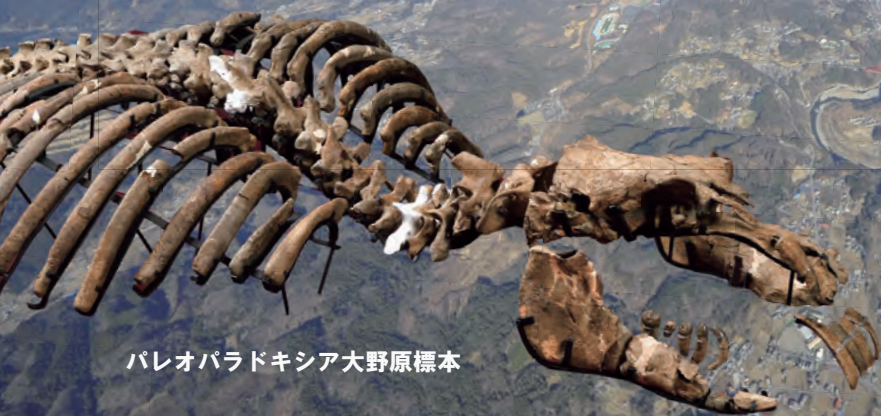
パレオパラドキシア大野原標本