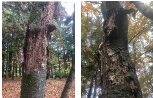
わんぱく広場の枯れた立木

問 今後、活動支援等の補助金は。 答 現在の補助金は立上げ支援のため、4年目以降の交付はないが、活動継続のため、会場費用に関する光熱水費など、費用負担が生じていることも承知している。交流の活性化と新規団体の増加が見込まれる中、今後の支援継続について、団体からの意見や市の介護保険財政も踏まえ、検討していく。