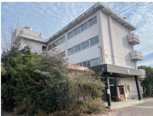
旧秩父東高の利活用については慎重な検討を

問 地域医療連携推進法人の設立は有用な制度であると考えているが、市長は何が最大のデメリットであると考えているのか。 答 詳細について勉強している。