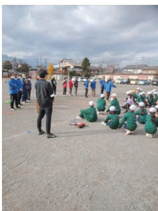
ペタンクの体験学習

答 人口減少や趣味の多様化により活動団体数、在籍者数、開催回数等、減少傾向にある。各年齢層に合わせた魅力ある講座の開催に努め、市報・ホームページ・公民館だより等で周知していきたい。