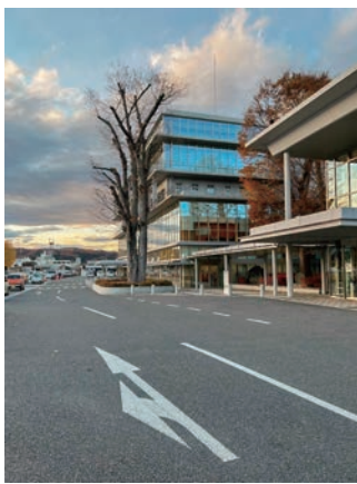
秩父市政は何処へ向かうのか

答 同地区を対象にまちづくり計画等を策定するため、専門業者を選定し、地元との連携の下、年度内に協議体を設置し作業を進める。