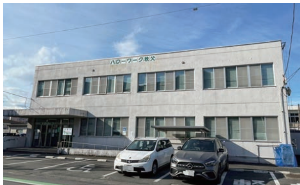
ハローワーク秩父

答 公的機関である農地バンクが間に入ることで、賃貸借契約の内容交渉を当事者がする必要がなくなり、貸し手には農地バンクから賃料が確実に振込まれるなど、取引の安全が確保される。また、貸し手に相続などが発生しても、農地バンクが対応するなどのメリッ