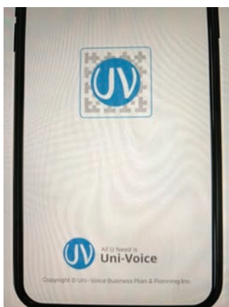
二次元音声コード「ユニボイス」アプリ

答 6年4月1日現在、障がい者手帳をお持ちの方は2027人、そのうち、視覚障がい者手帳の方は141人。65歳以上の高齢者は2万456人。今後、視覚障がい者の方からのニーズの把握や、他の自治体の取り組み事例を情報収集し、ユニボイスの有効活用について調査研究を進める。ユニボイスを導入した際には、市報やホームページ等で周知を図り、スマホ教室でアプリのインストールの支援は可能と考える。