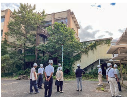
旧秩父東高の現地調査