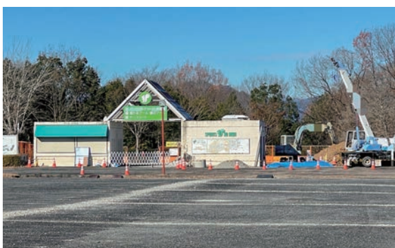
駐車場改修が進む秩父ミュージアムパーク

問 度途中のため未定である。 問 全国植樹祭を記念して、秩父夜祭の屋台・笠鉾、川瀬祭の屋台・笠鉾を飾り置きするとの事だが、飾り置き場所は。 答 秩父夜祭の屋台・笠鉾は秩父神社境内に、川瀬祭の屋台・笠鉾は本町・中町大通りおよび西武秩父駅に飾り置く予定。