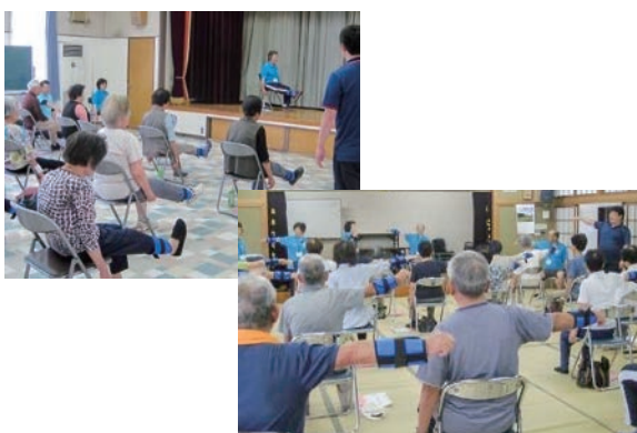
ポテくまくん健康体操