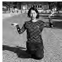
あらしき みか 新舗 美佳

毎年恒例4歳から気軽に参加できる回遊型イベン ト。今年は美術とダンスのワークショップ・人形劇 の3本立て！