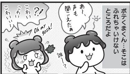
次元の壁を超えつつある、くまの妖精ポテくまくんでした