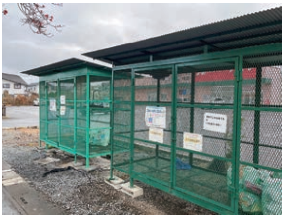
ステーション方式のごみ集積所