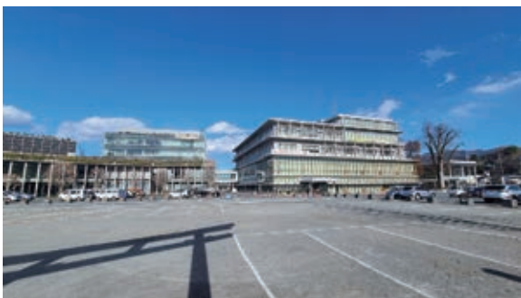
合併時の新市キャッチフレーズ 「まち輝き むら際立ち 森と水のちからほとばしる 助けあい 温もりのまち ちちぶ」