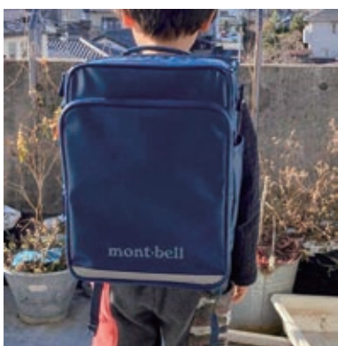
小学校入学準備品購入補助金の対象外となった製品

答 防犯ブザーの音を実際に聞いていただく機会を増やし安全確保に努める。また、モンベル社製のランドセルはリュックサックの類と認識しているため対象外とした。