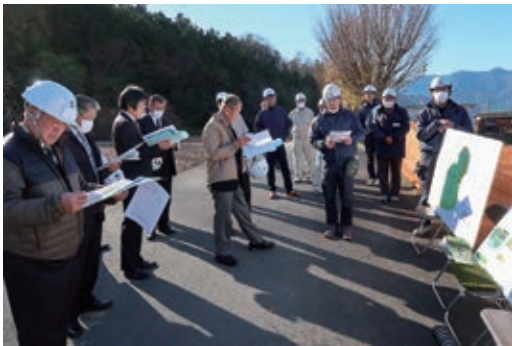
影森グラウンドの現地調査

意見 マイナンバーカードは、数々のトラブルや情報漏洩が明るみに出てきており、個人情報保護委員会がデジタル庁に情報漏洩の意識が欠如しているとの行政指導を行う状況である。市の事務負担も重い。市民にも市にも、メリットが少なく、計り知れないデメリットを持つマイナンバーカードの、政府による強引な利用拡大策に反対の立場であるので、その利用促進のための補正予算を計上したこの予算に反対する。 ○挙手多数により可決