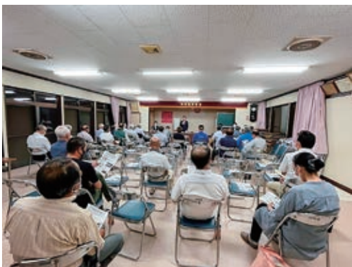
各地で行われている『ふれあい懇談会』

答 年間の貸出利用者数は6万人前後。年間を通じて各種の取り組みを行い、多くの市民の方に親しまれ、信頼される図書館を目指す。