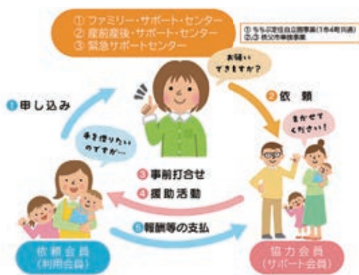
3つの産前産後・育児支援事業

答 協力会員には、9科目25時間、子どもの心や生活、小児の病気や看護、救急講習など多くの基礎について学んでいたことによる。身元確認としては、運転免許証等の提示を求めている。また、事前に子どもの状態や依頼内容を確認し合う、顔合わせを実施してからの利用開始となっている。