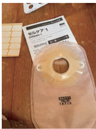
ストーマ装具（畜便袋）

県内の自治体では、蓄便袋8858円、蓄尿袋1万1639円、紙おむつ1万2千円としているところが多い状況。4年度の給付決定者は140人。他市と同じ給付限度額にした場合の見込み額は、4年度実績を基に試算したところ、差額は約31万円。財政担当と協議をしていきたいと考える。