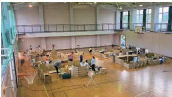
避難所体験キャンプの様子 (5年8月(一社)秩父青年会議所主催)

答 避難所体験キャンプは、防災意識の向上や避難所運営の円滑化につながる有効な事例であり、子供を持つ若者世代への防災訓練への参加のハードルを下げる効果も期待できる。各町会や各団体などから相談があれば、市としてできる限り協力していきたい。