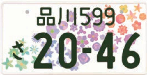
全国統一の図柄入りナンバー