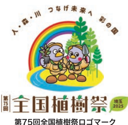
第75回全国植樹祭ロゴマーク