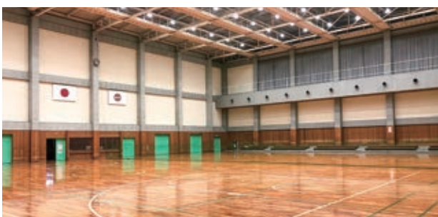
文化体育センター第2アリーナ