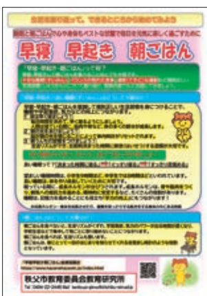
睡眠教育として小中学生に配布された「早寝・早起き・朝ごはん」

答 児童生徒の健全な発達、脳や心身の健康と密着に係る睡眠の確保は重要な生活課題である。質の高い睡眠や規則正しい生活習慣の重要性についてまとめたリーフレットを作成し市内全小中学校に配布した。児童生徒への指導および啓発活動を行っている。