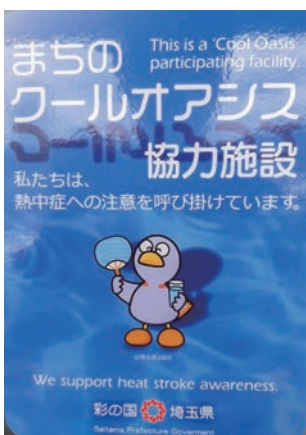
クールオアシスの協力施設

答 学習指導要領の趣旨を踏まえ、配備されている新聞を有効に活用し、発達段階に応じた新聞を活用した授業が進められるように、指導・助言をしていく。