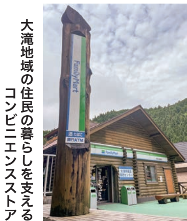
大滝地域の住民の暮らしを支えるコンビニエンスストア

5年3月定例会において、市長はこのコンビニエンスストアの存続について「建設コスト、そしてまた経営状況を見据えながら、今後について検討してまいりたい。」と答弁したが、大滝地域を支える住民の暮らしを守るために、この施設は住民に求められ、国の指し示す地方創生の事業の一部であるという認識を持って、運営を支えていただくことを切に願う。今後の運営について、市長の考えは。