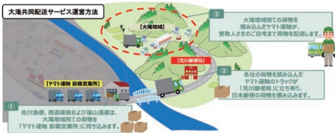
共同配送サービスの運営イメージ