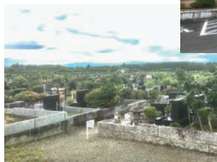
リゾート葬にふさわしい聖地公園『やすらぎの丘』