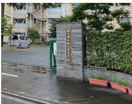
3年後に皆野高校と統合され、グローバル人材の育成を目指す秩父高校

問 6月に改正空き家対策特措法が成立したが関係条例等の改定は、策計画を6年1月に改定の予定。