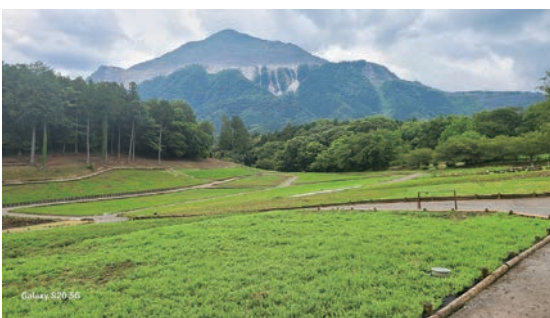
1年を通して除草作業が行われる芝桜の丘

約102万人をピークに減少をはじめ、コロナ過前の元年度は4万3千人、今年約24万人となった。ピーク時に比べると観光客数は減少しているが、毎年芝桜を楽しみに来る観光客も多く、秩父地域においても20万人以上を誘致する「芝桜まつり」は春の重要な観光資源になっている。今後はインバウンドの復活など、更に観光客は増加すると期待されるので、引き続き春季イベントの柱として継続しつつ、今後の方向性を含めさまざまな角度から検討していく。