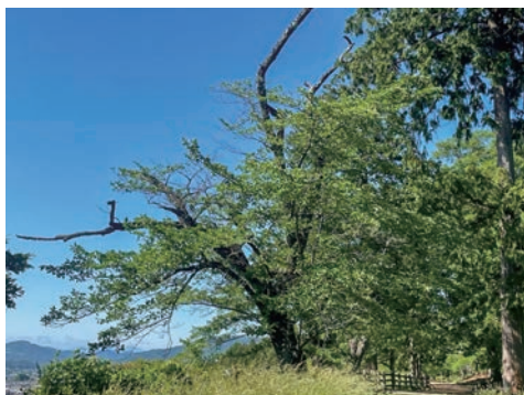
忠霊塔側に散見される老木幹そのものが枯れている

問 忠霊塔のある羊山公園北側には、倒木の危険のある木が散見される。5月末に羊山北側の法面の老木が強風で倒れ、国道299号が2時間にわたって通行止めになった。電話線に引っかかり、かろうじて大きな事故にはならなかったが、大型車は迂回できず大渋滞だったとのこと。坂氷交差点のすぐ脇には、完全に枯れて蔦が