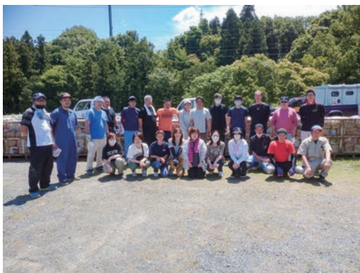
廃品回収をする育成会の皆さん

答 合同点検の進捗状況は、45.5%となっており、5年度末までには、100%を目指し取り組んでいく。