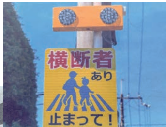
横断者注意喚起灯

答 (仮称)秩父地域社会参加サポートセンターで引きこもり支援、孤独・孤立対策を併せて実施し「孤独・孤立対策推進地域協議会」を設置する予定。