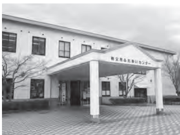
ふれあいセンター

答 今までも障がい者以外の方も利用していたが、今回その利用の範囲を明確にするもの。これまでも、障がい者の方を優先し受付を早く開始し、障がい者の利用が狭まらないように注意を払っていた。そうしたものを継続していく。