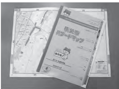
4年度に新たに作成される「秩父市ハザードマップ」