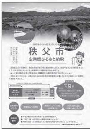
企業版ふるさと納税チラシ

問 基金の具体的な使用方法は。 答 市の地域再生計画に掲げるものに賛同していただける企業からの寄附を基金として積み立て、目的に合った事業に充てていく予定。