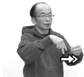
左手で作った輪を、右手人さし指と中指で弾きます。