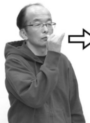
右手の親指と小指を立て、親指を鼻に付け前に出します。