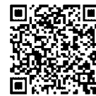
「クックパッド 秩父市公式キッチン」

クックパッド「秩父市公式キッチン」でレシピを紹介しています！随時更新予定です。ぜひ毎日の食事にお役立てください。