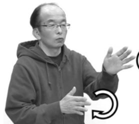
両手を開き、走るように交互に振ります。