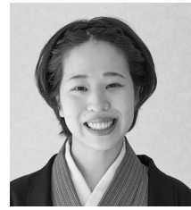
ここんてい ひなまく 古今亭 雛菊