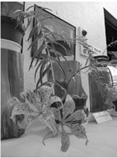
ミヤマスカシユリ