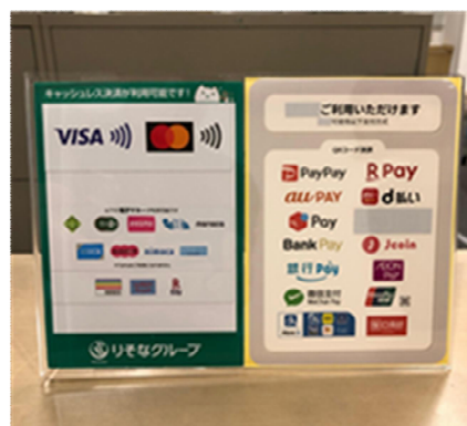
利用できる決済サービス