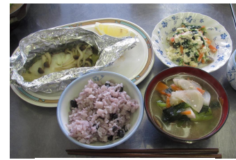
簡単健康料理教室