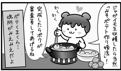
さてはほとんど全部食べるつもりだな?