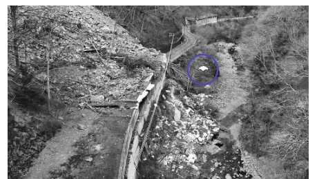
土砂崩壊の近くで飛行するドローン(丸囲み内)

大滝総合支所(中津川地内生活支援) ☎55-0861 産業支援課(ドローン配送関連) ☎25-5208