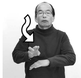
「書道」という意味もある