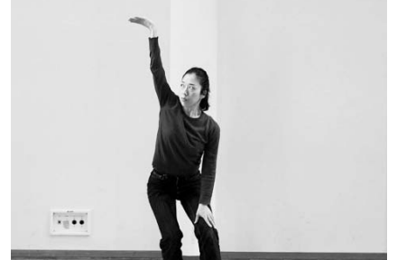
神村 恵