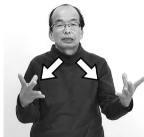
「新しい」という意味もある