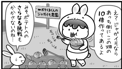
お野菜をバランス良く食べて健康的な1年にしようね