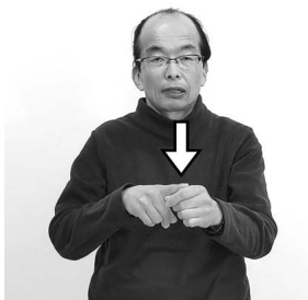
「年」という意味もある

手のひらを上にして軽く握った両手を前に出しながら開きます。次に、左手こぶしの親指側に右手の人さし指を下ろして当てます。