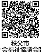
秩父市社会福祉協議会