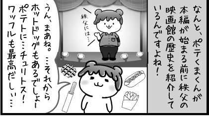
フードばっか(笑) それは他所の映画館でも共通ですよー