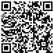
マイナポイント事業HP