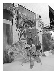
ミヤマスカシユリ

武甲山資料館では、秩父太平洋セメント(株)のご協力をいただき、「ミヤマスカシユリ」を特別展示します。