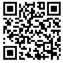
「コンビニエンスストア」