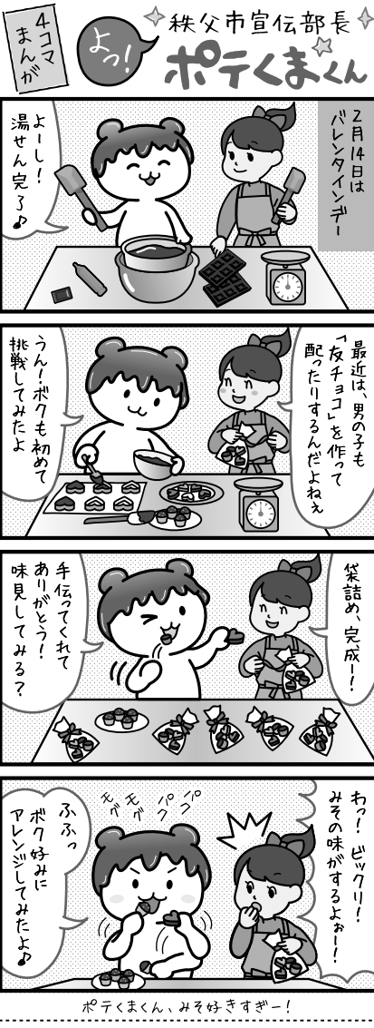
ポテくまくん、みそ好きさぎー!