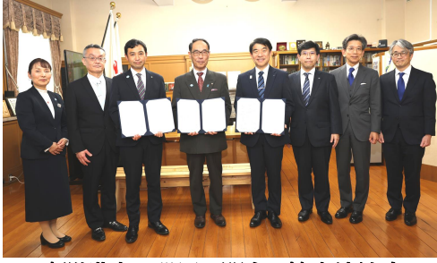
寄附講座の設置に関する協定締結式 (令和8年4月7日 埼玉県庁にて)