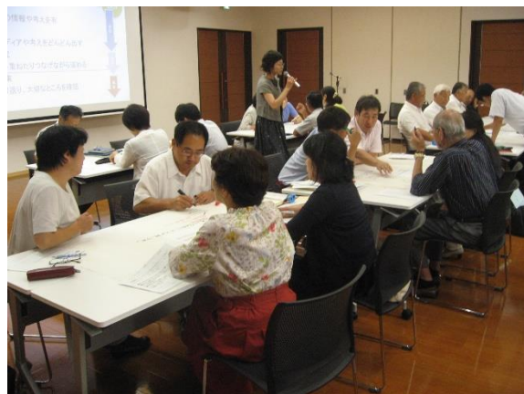
講師の先生の指示に従いながら～