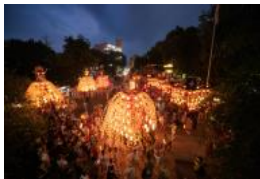
7月19日秩父神社境内の様子