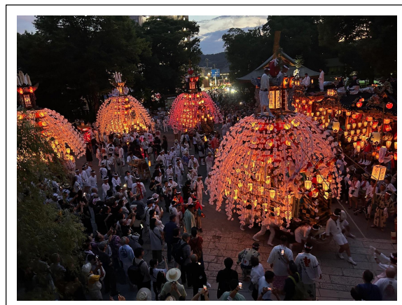
■7月19日 秩父神社境内

川瀬祭の主役である子供たちは、厳しい暑さの中でも囃子手、拍子木や曳き子を元気に務めていました。また予定されていた主な行事も予定通りに行われ、土日開催となったことで多くの観光客にお楽しみいただきました。