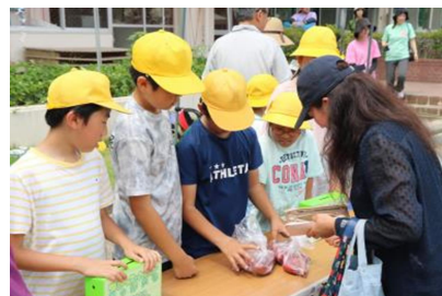
【7月 カレー作り・野菜の販売】