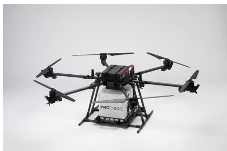
<本実証で活用予定のドローン：PD 6 B-Type3>