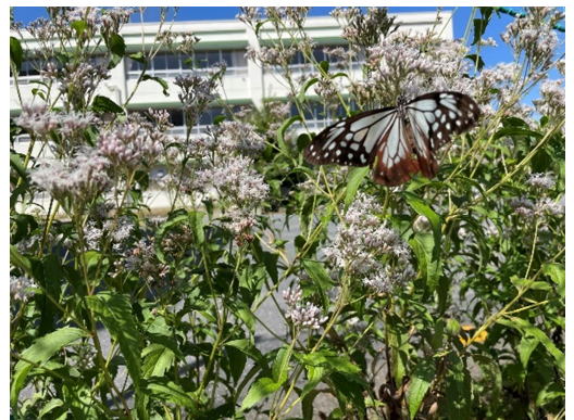
西小に飛来したアサギマダラ

実施時間 ① 8:30~9:15 フジバカマの植栽活動 3年生児童 ② 9:25~10:10 フジバカマの植栽活動 4年生児童