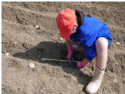
【じゃがいもの植えこみ】