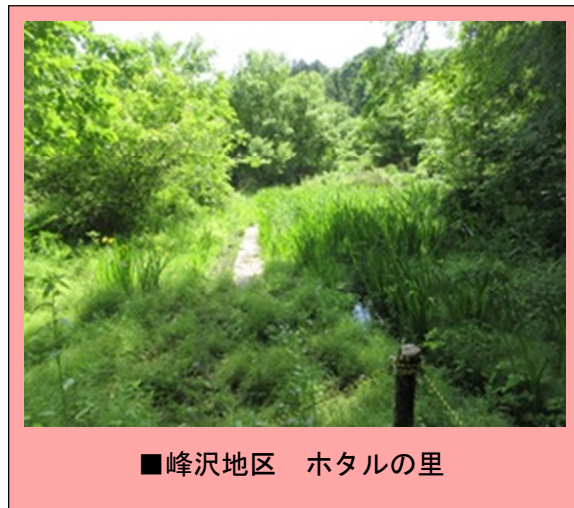
■峰沢地区 ホタルの里

ホタルが生息するためには、どのような環境が必要なのかなど、SDGsを基に、「今、自分たちができることは何か」を考え、平和で安全、安心な社会づくりを考えるきっかけとして、ワークショップを行います。