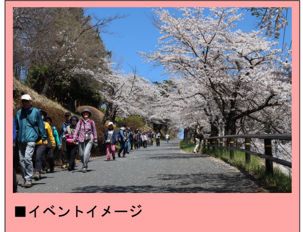
■ イベントイメージ