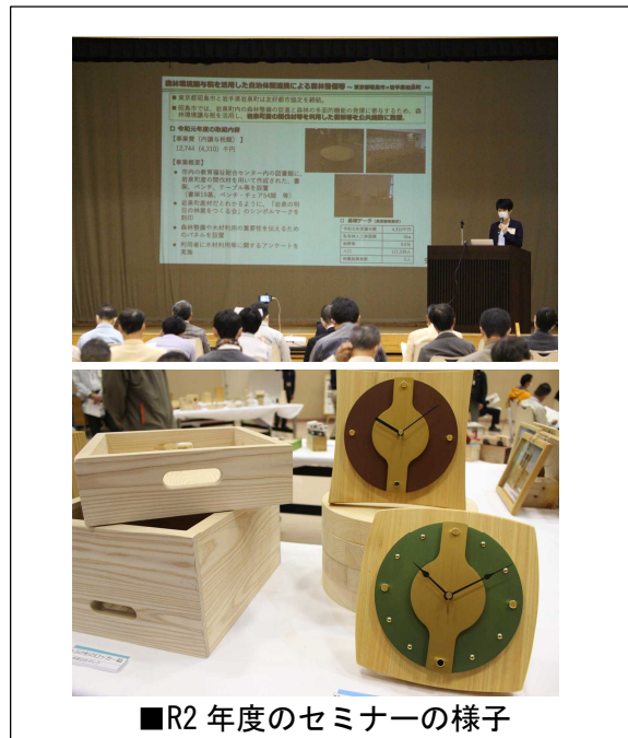
■R2年度のセミナーの様子