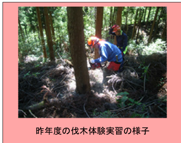
昨年度の伐木体験実習の様子