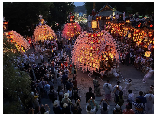
昨年7月19日秩父神社境内の様子