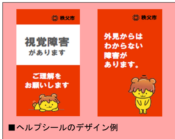
■ヘルプシールのデザイン例