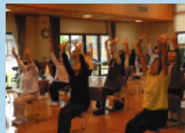
高齢者筋力アップ教室