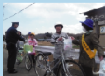
交通安全キャンペーン