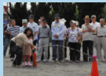
地域の自主防災訓練