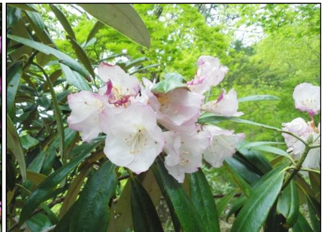
写真：秩父市大滝・大血川シャクナゲ園