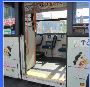
ノンステップバス