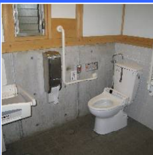
たもくてき 多目的トイレ