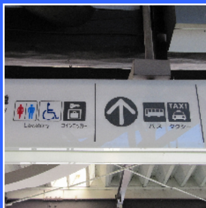
えもじ あんない 絵文字の案内サイン