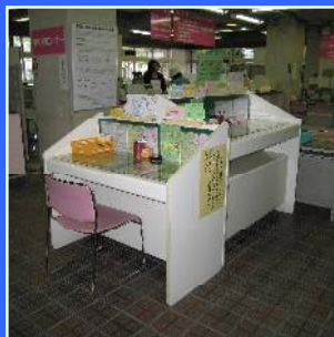
たか ちが きさいだい 高さの違う記載台