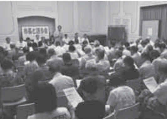
原谷公民館会場の様子

答 「雇用を促進すること」を優先して取り組むべき行政課題の一つと認識し、雇用就労対策を実施しています。