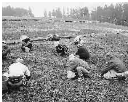
早朝からのボランティア活動 ありがとうございます！