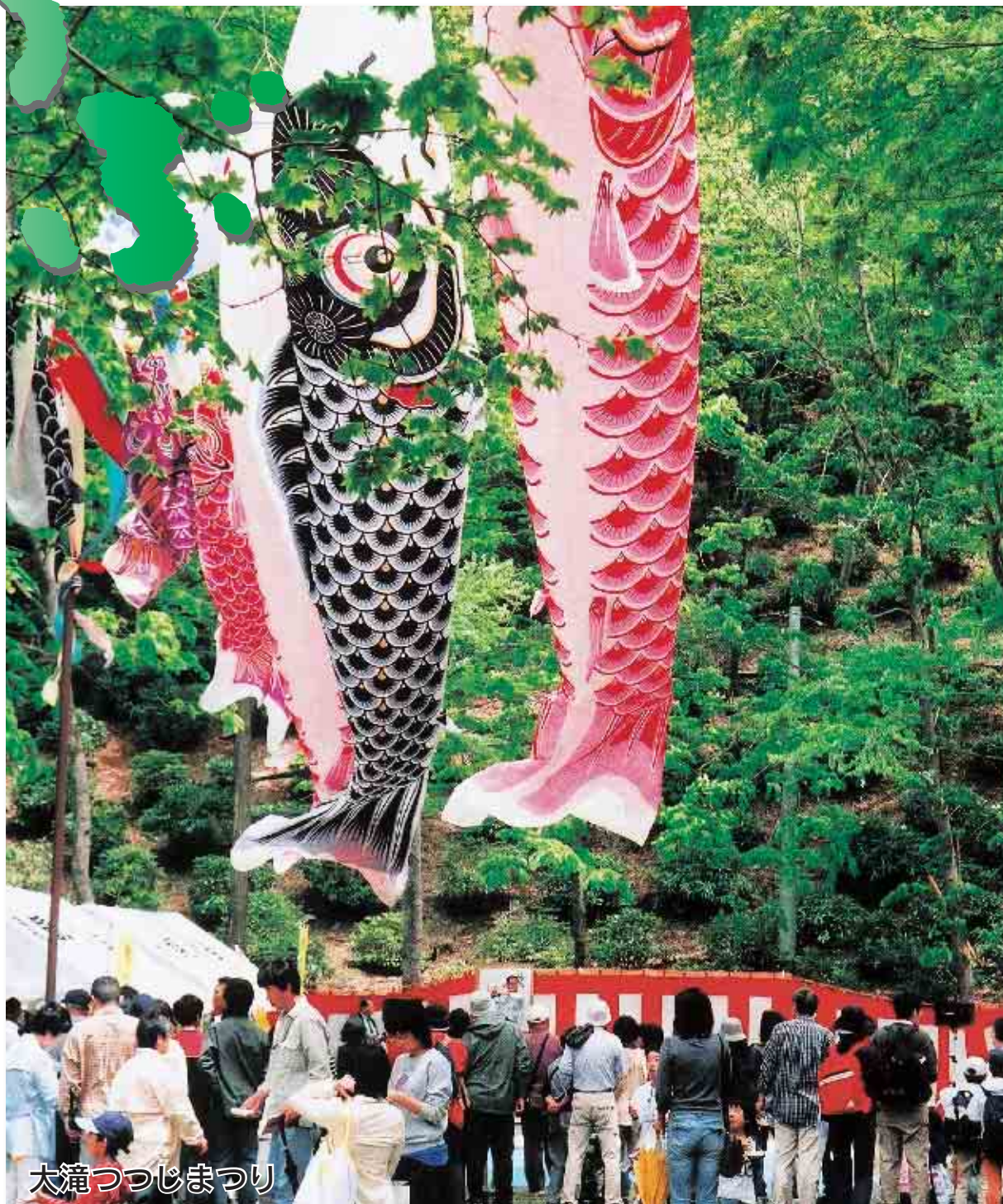
大滝つつじまつり

[世帯数] 26,091世帯 平成17年4月1日現在 (人口・世帯数は 外国人登録を含む)