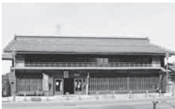
ほっとすぽっと秩父館