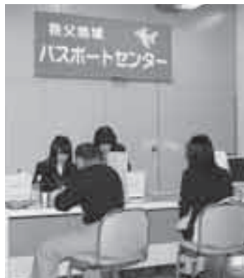
パスポート申請受付の様子

このセンターオープンにともない、他のパスポートセンターでの申請・受領はできませんのでご注意ください。なお、申請等の詳細は、市報ちちぶ3月号をご覧ください。 ※申請時に必要な写真は、パスポートに転写されますので、画