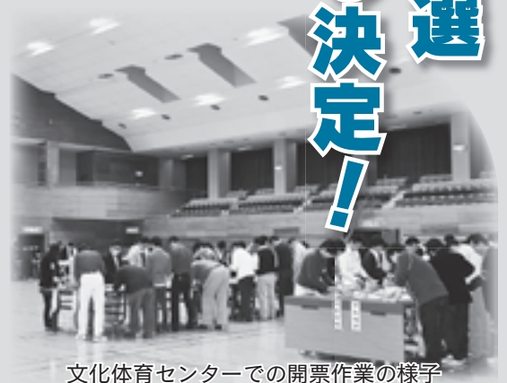
文化体育センターでの開票作業の様子