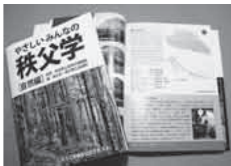
今回発刊された『やさしいみんなの秩父学』(自然編)

※テキスト(定価2,000円)は、市内書店(藤村書店・時習堂・小石川書店・神林書店・読書ク