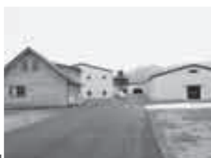
▶ベンチャーウイスキー 秩父蒸溜所

今、樽に入ったウイスキーたちは長い熟成という旅に出たばかりですが、いずれ皆様と秩父産のウイスキーを愉しみたいと思っております。秩父に乾杯！