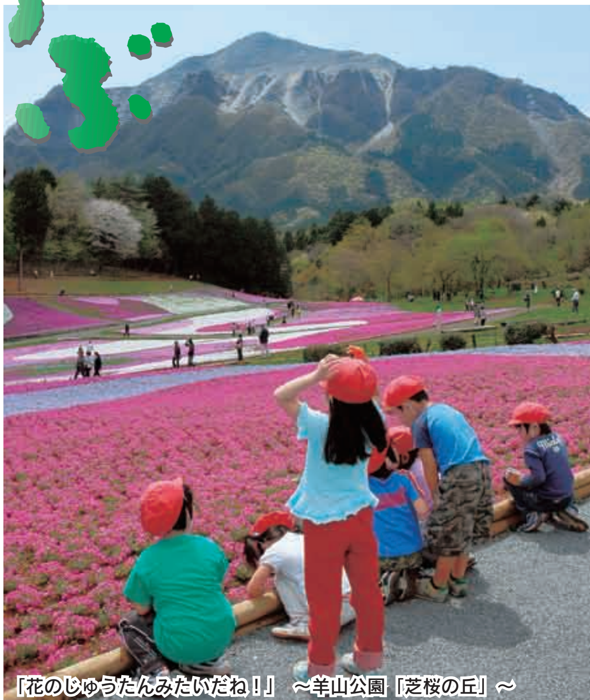
「花のじゅうたんみたいだね！」 ～羊山公園「芝桜の丘」～

発行所 秩父市役所 電話 0494-22-2211(代表) 〒368-8686 埼玉県秩父市熊木町 8 番15号