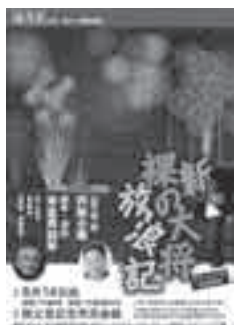
海流座 「新裸の大将放浪記」