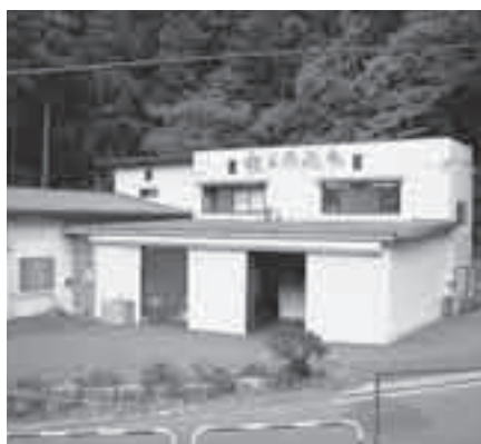
秩父源流水本社・工場

す『真面目な商品作り』をモットーに『安心、安全、おいしい』商品を提供してまいります。水市場の拡大にともない、市場ニーズに対応できる企業を目指してまいります。