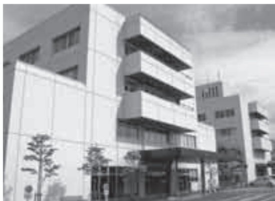
秩父地域の中核をなす市立病院