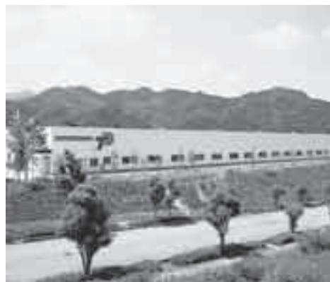
東洋パーツ株式会社みどりが丘工場

ラインを自社で構築し、作業を行 う従業員に優しい環境を創ってい ます。 給与体系は、努力する人間が評 価されるようにしています。 また、福利厚生として、群馬県 草津温泉に会社の保養所を設けて いるほか、全社員での運動会、パー ベキュー大会なども行っています。 さらに、社内には、スキークラブ、 ゴルフクラブ、写真クラブなどの 同好会があり活動を行っています。 今後は地球環境に優しい工場環 境作りとエコカーなどの自動車