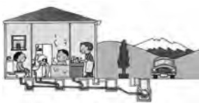
※（公社）日本下水道協会イラスト集より