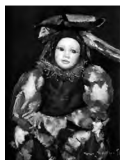
0号 油彩 ジョーカーのチルドレン

とき 5月18日(土)〜6月2日(日) ところ ギャラリーかみいし(宮 側町18-17) 問色川 ☎090-3220-111 55