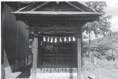
山田地区、恒持神社内の諏訪神社

答 4年6月の秩父市文化財保護審議委員会にて、継続調査をするべき物件であるとの判断となった。