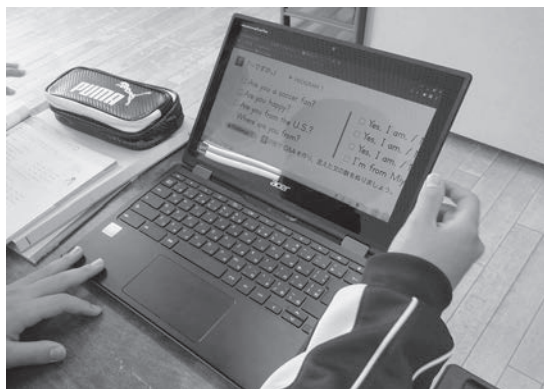
市内小中学校で使用されている学習用端末

問 数が削減できるという動きがあるが、果たして子どものためになっているのか疑問がある。デジタル化が進められる方向にあることは否定できないが、子どもたちや現場の教職員の声を聞き、それを生かす必要がある。考えはどうか。 答 各学校のICT活用の実践や課題を集約して市内学校で共有している。また、今後は、ICT支援員による学校の巡回支援も充実させ、現場の声を活かしていく。