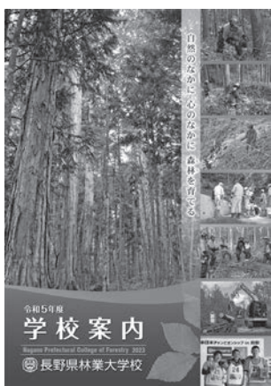
長野県林業大学校のパンフレット(表紙)