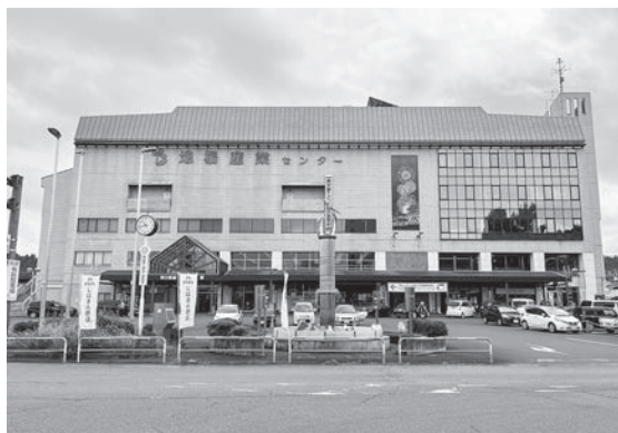
市への一部寄附が決まった地場産センター

答 当該建設物は1985年竣工で、秩父鉄道と秩父商工会議所との共同所有である。過去に大規模改修は未実施で、今後は築45年を目的に大規模改修を実施し、最終的には70年の耐用年数を目指した