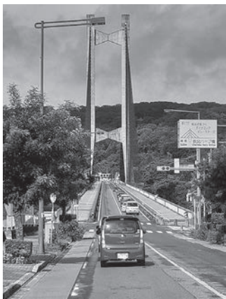
渋滞解消が望まれる公園橋通り

の整備に向けた調整にも着手している。また、国道140号秩父陸橋平面化に伴う国道140号と市道(中央)642号線の新交差点の整備において県と市が一体となって、円滑な交通の確保に向けた設計を進めている。さらに中心市街地の交通渋滞対策と合わせ、今後の更なる地域の活性化、利便性の向上を目指すため、秩父駅東側の活用を踏まえた新たな道路整備計画についても検討が必要なものと考えている。