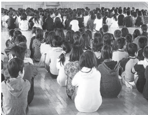
集団で行う体育座り

の授業等で実施されている坐法で、文部科学省による体育の手引きにも紹介されている。この体育座りが、内臓を圧迫し座骨の痛みや、腰痛を引き起こす原因の一つであることが心配されるが見解は。 答 腰を下ろして長時間同じ姿勢を維持することは内臓を圧迫するなどの影響があると考える。必ず同じ姿勢でいなければならぬ理由はないため、あぐらや正座など他の坐法も用いて状況に応じた座り方を指示していく。