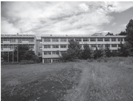
現在の旧秩父東高

答 学校長の判断で部活動の新設が行われる。しかし、部活動の環境は厳しく、運営は学校から地域へ移行していく環境にある。ペタンクが健康増進、青少年の育成に