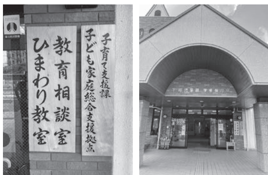
4年度から設置された子育て支援課

● こども家庭庁 問 こども家庭庁創設にあたり市の取り組みは。 答 こども家庭庁創設に先駆けて4年度から子育て支援課を設置した。0歳から18歳までの全ての子どもと、その家庭および妊産婦の方々が抱えるさまざまな悩みに対し、関係機関と連携を図りながら、実情に応じた適切なサポート支援を行っている。