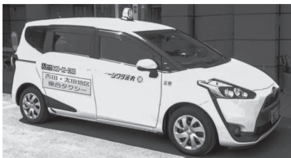
現在運行している吉田・大田地区乗合タクシー

日の利用30分前まで乗車予約ができるようになる。運行は市内のタクシー会社が行い、利用料金は1回につき500円、65歳以上の方は1年度2千円（500円×4回分）の助成。70歳以上の方、障害手帳所有者などは300円となる。中長期的な発展については、地域公共交通全体で、交通事業者を交えて総合的に検討する必要がある。