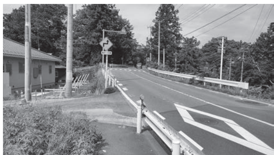
荒川久那地内の歩道整備工事

久那地内常盤橋前後の区間で山梨方面に向かって左側の工事を進めている。②荒川日野地内、荒川中学校から武州日野駅周辺の区間で、測量業務が終了し、設計業務を行っている。設計業務が終了した段階で、用地・補償等の調査および地権者との交渉を進めていく。③荒川白久地内、荒川郵便局付近の整備は道路の詳細設計を行っており、今後橋梁の予備設計等を行う。設計業務が終了した段階で、用地・補償等の調査および地権者との交渉を進めていく。