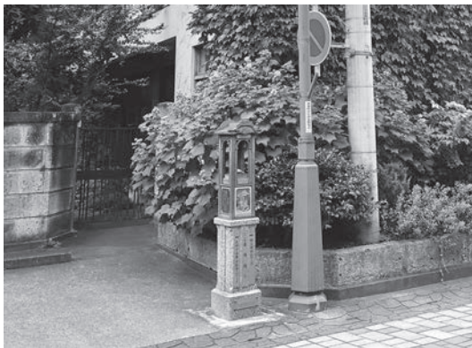
開運案内板どこいくべえ