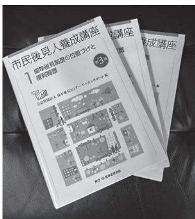
市民後見人養成講座テキスト

創業に向けた経営計画などのノウハウを習得していただき、新たな創業者を増やしている。リノベーション創業支援事業補助金を4年度より創設し、創業者への支援を強化する。3年度は、受講者の中から5人が市内で創業した。創業支援対象者はコロナ禍により減少したが、1市4町で連携して創業の機運を作り出していきたい。