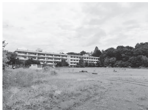
旧東高等学校のグラウンドと校舎

答 市民の皆様には正しい知識と理解、認識を持っていただくため、関係団体と協力を図りながら啓発活動等に取り組んでいる。