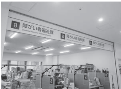
障がい者福祉課窓口

答 3年4月から秩父地域自立支援協議会の専門部会において、支援のための検討が始まった。医療的ケアが必要な方への支援を引き続き検討・研究していく。