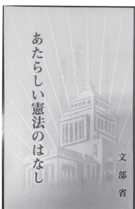
1947年、中学1年生の社会科教科書として発行された『あたらしい憲法のはなし』

答 6月初めに小学校を対象に業務量の変化を調査したところ、13校中12校が「業務量が増えた」と回答した。教員が多忙化している。補助員がどうしても必要であれば補充を考えたい。