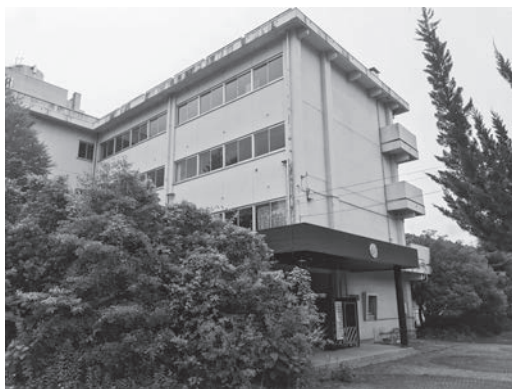
現在の旧東高等学校の様子

問 旧東高等学校の活用についても、今までの公共施設等総合管理計画にのっとって検討するのか。 答 既存の計画にのっとって検討する。