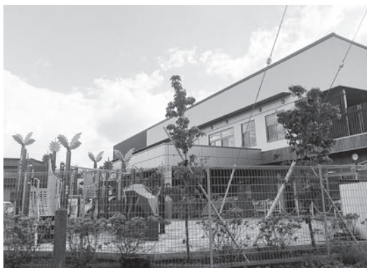
秩父の福祉拠点の1つである「にじいるテラス」

答 各施設の受け入れの検討を進めるとともに、役割については、責任をもつて責務を果たしていく。予算については交付税措置されるため費用の負担は少なくなる。役割については省庁、県、自治体が行う支援に対し、努力義務ではなく責務が課せられるが、市の見解はどうか。