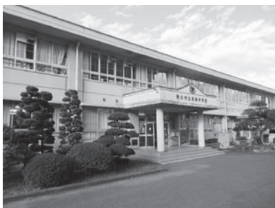
大規模改造工事が行われる影森中学校

答 工事着工前に施工業者と安全対策に対して打ち合わせを行い、通学時や部活動等にも配慮して工事を行う予定である。