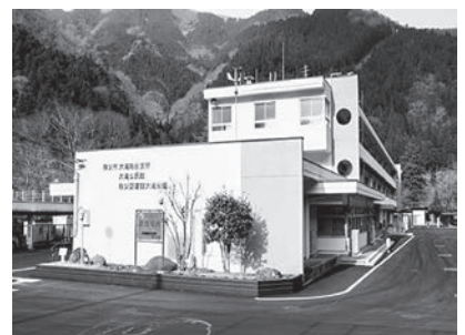
移転先の大滝総合支所

問 廃止後の大滝老人福祉センターは今後どのような扱いとなるのか。 答 貸与、譲渡、売却などを含め検討していく。