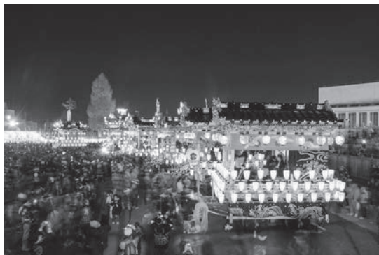
秩父夜祭の笠鉾・屋台

問 市民との約束であればなおさら、市長のホームページ等に掲載するなどして、真摯に訂正し、市民に対して説明責任を果たすべきでは。