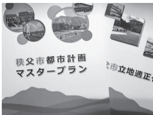
都市計画マスタープラン

答 合併特例措置が終了した現在、財政の健全化は最優先事項であり、現状の中期財政計画のローリングを基に予算編成等、事業計画をコントロールし、適切な財政運営を実施していく。具体的な方法としては、市民目線に立つて事業の取捨選択、無駄の排除を基本に据え、実施事業をこれまで以上に極め、精査していきたい。また、自主財源の確保を図る市税の増収策に取り組む。