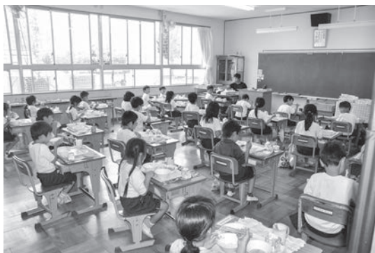
花の木小学校の給食の様子

公約を果たすために、9月定例会に補正予算案を上程し、子育て支援対策の一環として、小学校