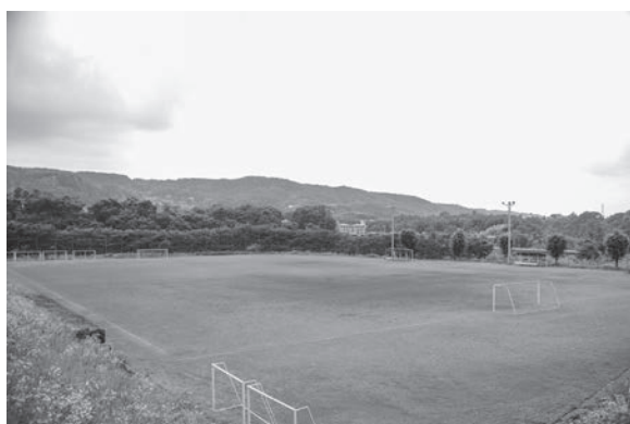
現在の影森グラウンド

答 消防団員制服基準の改正後、 数年経過し、他自治体の消防団活 動服の変更が進んできている。今 後、消防団幹部会議等において、 団員の意見も伺い、変更について 検討・協議を行っていく。