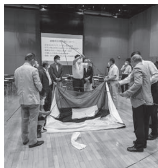
避難所設営のシミュレーション