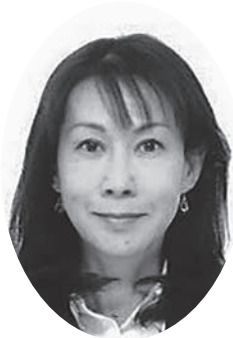
みやま え 宮前 昌美 議員 62歳