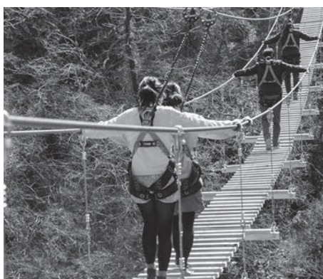
秩父ジオグラビティパーク

答 長さ500メートル程の規模が大きいジップラインが整備される計画があるが、それ以前にバンジージャンプが始まる計画があり、それぞれの準備が整い次第、順次開業する予定である。