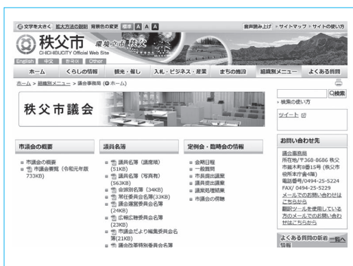
秩父市議会ホームページ