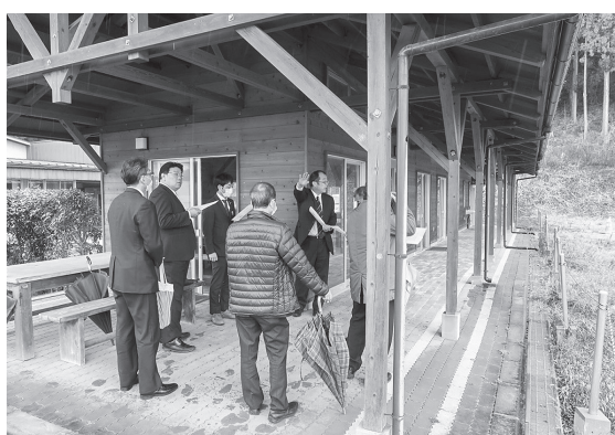
現地調査の様子(荒川巡礼通りふれあいセンター)

○以上3件は挙手多数により可決 ◆2年度介護保険特別会計予算 ◆2年度市立病院事業会計予算 ○以上2件は原案のとおり可決