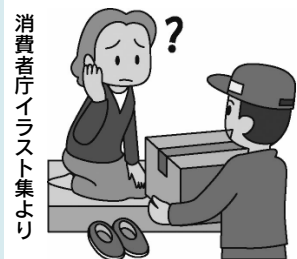
海外の植物

アドバイス 同様の相談がアメリ カやカナダでも発生し ました。中 身は植物の 種で数種類 が特定され ています。