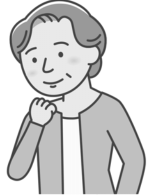
④ひじを下に突き出します。

※前回し、後ろ回しをしたら両手を下ろして運動の効果を確認しましょう。 ※反対側も同じように行います。