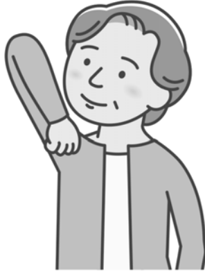
②背中から大きくひじを動かす意識でひじを上突き出します。