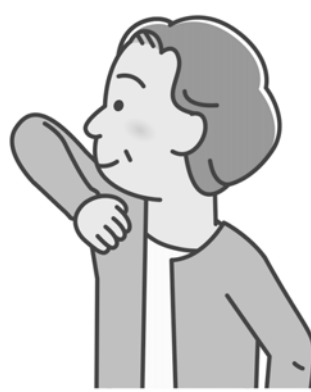
③ひじを後ろから突き出します。