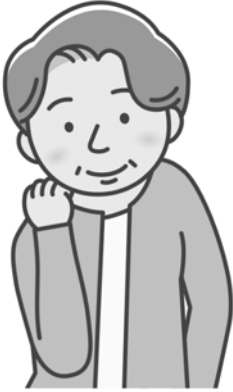
①片側のみまわす方向を交互に行います。

ゆっくりひじで「まる」を描いて少しずつ大きく回します。体全体を使って大きな円を描くと背骨の運動になります。