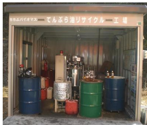
ちちぶバイオマステんぷら油リサイクル工場