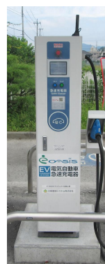
道の駅 急速充電設備