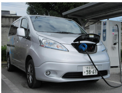
急速充電中の電気自動車