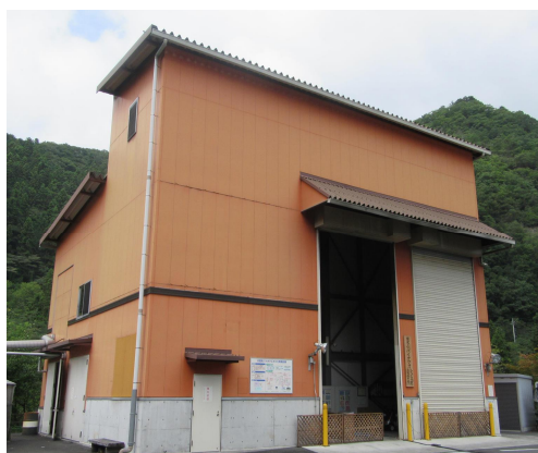
ちちぶバイオマス元気村発電所

2022（令和4）年度は、新型コロナウイルス感染症感染防止対策を講じながら、5名の見学者を受け入れました。