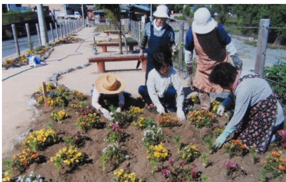
参加町会での植栽作業

市では、この事業をより効果的に実施していくため、引き続き協議会と連携しながら、随時実施内容の見直しを行い、住みよく、ふれあいのある生活の確立を目指した花いっぱい推進事業を展開できるよう努めていきます。