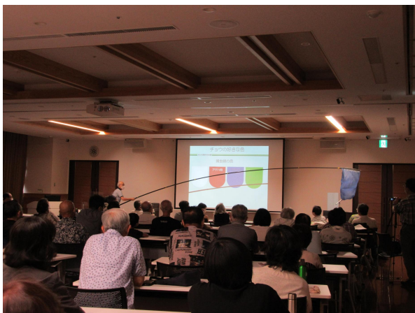
第2回環境セミナー 「秩父のチョウ」

市では、引き続き、市民会議が循環型社会の実現につながる様々なプロジェクト活動を実施できるよう、連携を図りながら運営のサポートを行います。