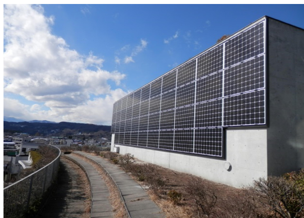
秩父市歴史文化伝承館壁面の太陽光パネル

太陽光発電設備をはじめとする再生可能エネルギーによる創エネの拡大・拡充のため、市特有の豊かな自然と景観に配慮しつつ、引き続き太陽光発電事業の適正な実施と推進のために取り組んでいきます。