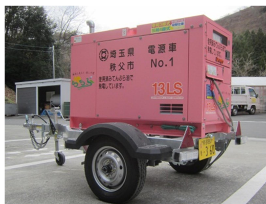
牽引式発電機 （燃料に BDF を使用）

廃食用油は、市民の協力のもとに集められた地域資源です。これからもこの貴重な地域資源の有効活用と、適切な使用に取り組んでいきます。