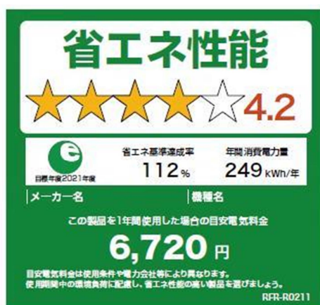
統一省エネラベル

市では、今後も市民の需要に対応した助成金の充実を図り、省エネ家電の普及を促進して、温室効果ガス排出量の更なる削減を目指します。