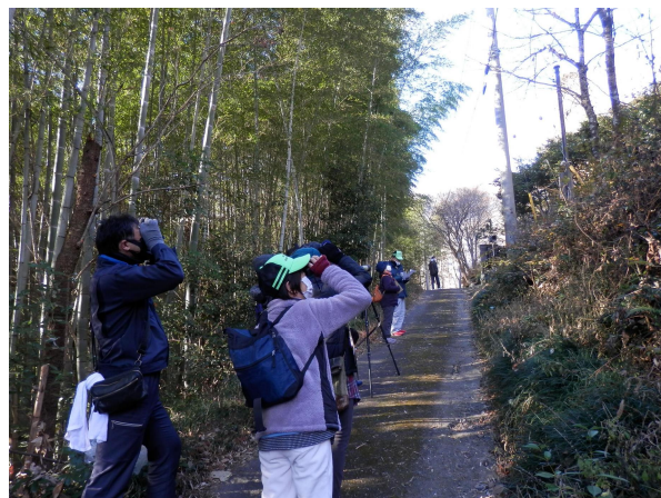
ミューズパークのごみ拾いと 冬鳥の観察