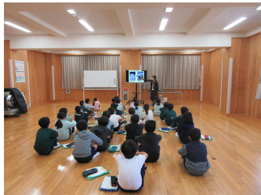
南小学校での授業の様子

小中学校では社会や理科等の科目の一部で地球温暖化や環境保全等に関する内容を取り扱っていますが、新たな試みとして、教科の枠にとらわれずに総合的な視点から環境について学ぶことができる「環境教育プログラム」を作成し、2018（平成30）年度から市職員が実施希望のあった小学校に出向いて授業を実施しています。