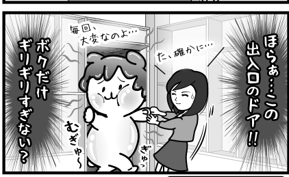
▲コレが見られるのも魅力の一つ?!▶ 秩父おもてなしTV 収録