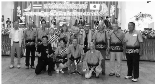
昨年の訪問の様子

申・問 4月18日(水)までに秩父吉田ヤソトン会事務局(吉田総合支所市民福祉課内 ☎77-1113)へ