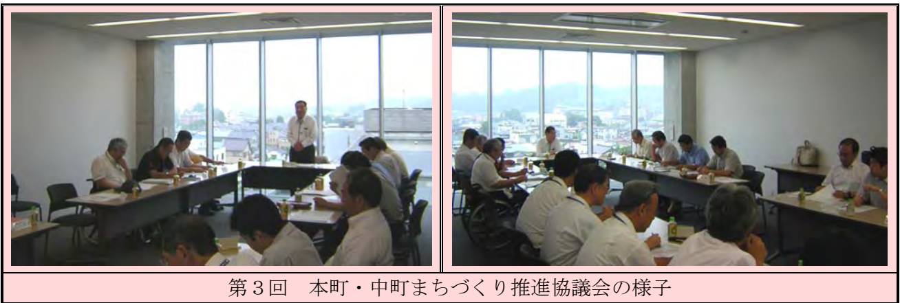
第3回 本町・中町まちづくり推進協議会の様子

平成20年8月5日（火）午後2時から、第3回本町・中町まちづくり推進協議会が開催されました。各町会の代表者や商工会、県の方々にお集まりいただき、まちづくり計画についてご協議いただきました。