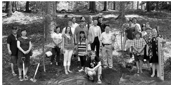
羊山公園にてカエデを植樹

50年という長い交流の歴史を振り返り、今後も末永く続くことを確かめ合った記念すべき年となりました。