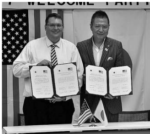
両市長による調印式

また、両市長が「秩父市とアンチオック市との姉妹都市協定」に署名し、今後も友好関係を深めていくことが宣言されました。