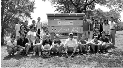
羊山公園アンチオックパーク

50年の交流の中で、延べ386人が秩父市からアンチオック市を訪れ、223人がアンチオック市から秩父市へ訪問されました。