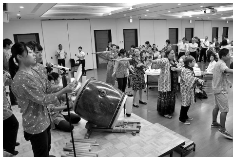
ウエルカムパーティーでの秩父音頭